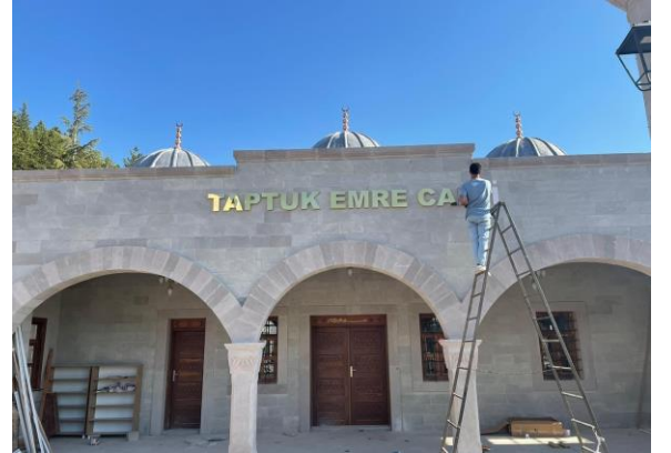
Taptuk Emre Türbesi Restorasyon Projesi