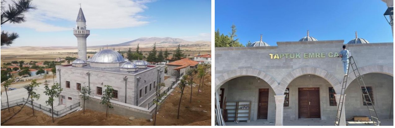
Taptuk Emre Türbesi Restorasyon Projesi

2022 yılı içerisinde Taptuk Emre Türbesi Restorasyonu tamamlanmıştır.